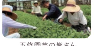
五條園芸の皆さん