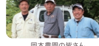
岡本農園の皆さん