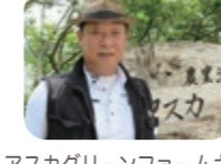
アスカグリーンファームさん